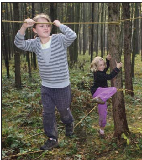
Toulání s Kondorem