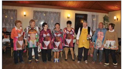
Martinská zábava v Klubu důchodců