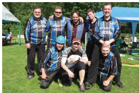
Družstvo mužů nad 35 let