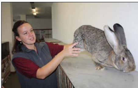
Výstava chovatelů drobného zvířectva