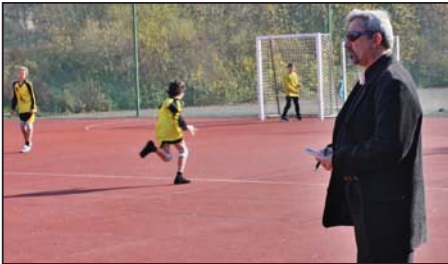
Házená je sváteční událost, aneb trenér ve fraku