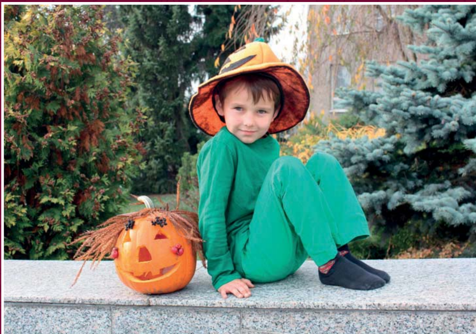
Haloween v základní škole