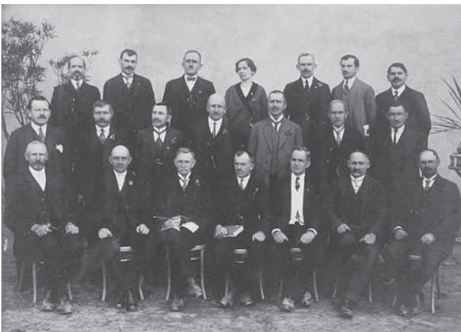
Na fotografii se nacházejí (popis: jméno a příjmení – profese, číslo domu)

Zdroje: [1] Pamětní kniha Staré Vsi n. O. - 1. díl (1921-1958)