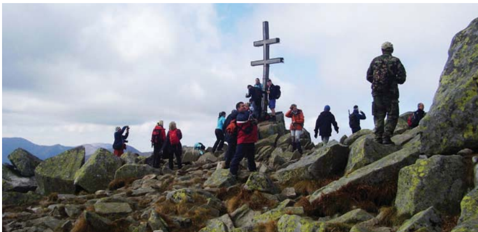
Na vrcholu Ďumbieru

den, protože zájezd začínal v pátek v odpoledních hodinách, jsme se stihli pouze ubytovat v turistické chatě ve slovenských Oraviciach. Ráno nás čekal přejezd do polského Zakopaného. Zájemci odtud vyjeli lanovkou do téměř dvoutisícové výšky na Kasprowy Wierch. Zbytek účastníků pak autobusem dojel na parkoviště na Palenici Białczańskiej. Odtud pak vystoupali kolem vodopádů Mickiewicza k největšímu polskému vodopádu – Wodospadu Siklawa a pak do doliny pěti velkých polských ples (Dolina Pięciu Stawów Polskich) a až k nejvýše položené horské chatě v Polsku - Schronisko PTTK w Dolinie Pięciu Stawów (1671 m n. m.). Dále pak mohli dojít k největšímu tatranskému plesu – Morskiemu Oku a odtud dojet koňským vláčkem k našemu autobusu na parkovišti. Na zpáteční cestě jsme v Zakopanem přibrali „lanovkáře“. Ti mezitím sestoupili přes sedlo Krab k plesu Czarny Staw Gasienicowy a přes horskou chatu Murowaniec právě do Zakopaného. Večer byla možnost navštívit v Oraviciach místní termální areál – Meander park a po dobré večeři posedět a zazpívat s kytarami. V neděli pak byla možnost vystoupit na bájnou, pověstmi opředenou polskou horu tyčící se přímo nad Zakopanym, na dolomitový Giewont (1894 m n. m.) nebo se alternativně nabízel procházka kaňonovitou dolinou (Dolina Kościeliska) s možností navštívit několik volně přístupných jeskyní. S počasím jsme měli štěstí v neštěstí. Přestože v Čechách v tomto termínu zuřily záplavy, v Tatrách se v tuto dobu nacházel