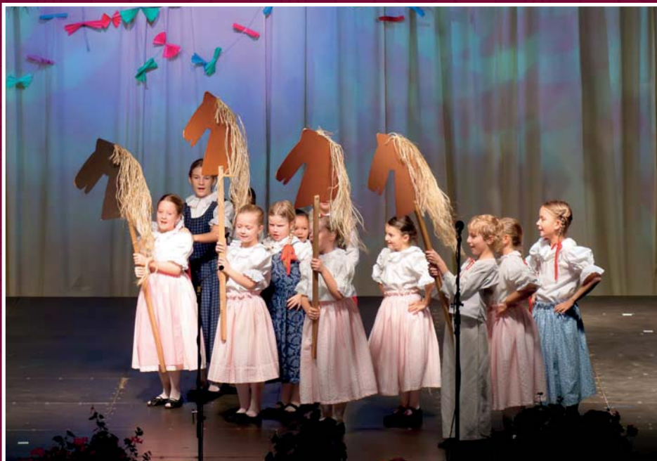
Podzimní slavnost – Lašský soubor písní a tanců Ondřejnica a Malá Ondřejnica