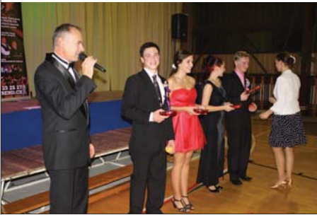
Půlkolona v hale TJ