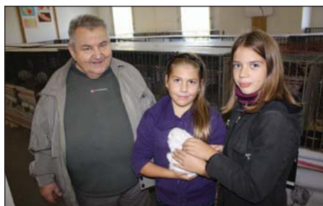
Výstava chovatelů drobného zvířectva