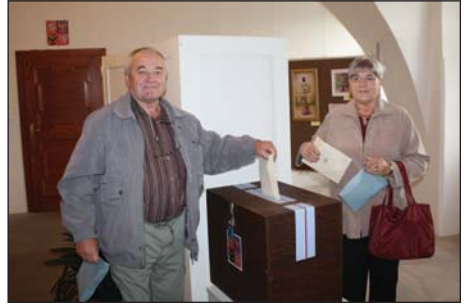
Volby do poslanecké sněmovny – okrsek č. 2 v zámku