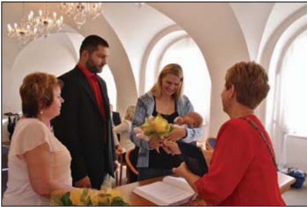
Vítání občánků na staroveském zámku