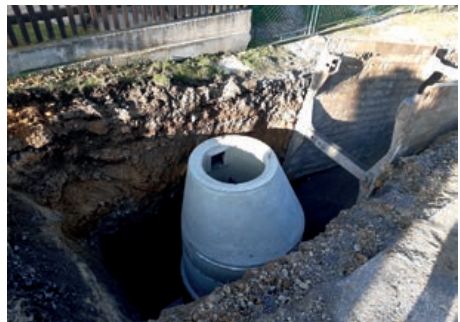
Stavební práce v ulici Hyneččkova

Již od počátku roku probíhaly práce na přípravě projektu kanalizace, jejímž vyvrcholením