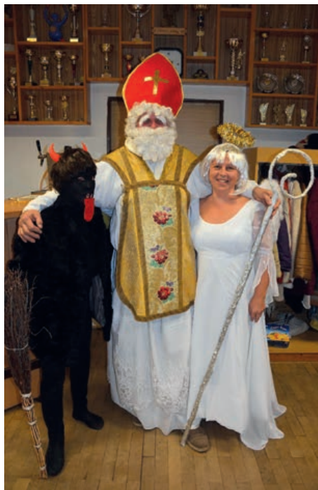
Mikuláš si mezi důchodce přivedl pomočníky