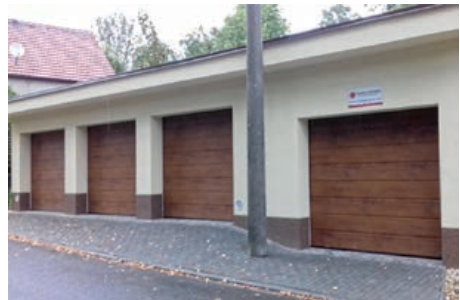
Nově zkolaudované garáže

Studii si můžete prohlédnout na www.studenka.charita.cz . Také díky Vašemu přispění jsme mohli dokončit výstavbu garáží, které jsou již zkolaudovány a využívány.