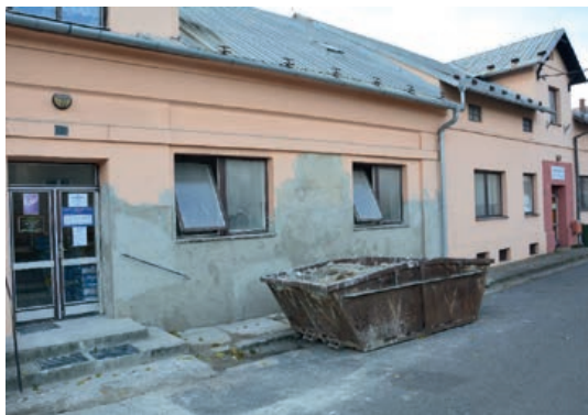
Rekonstrukce části zdravotního střediska