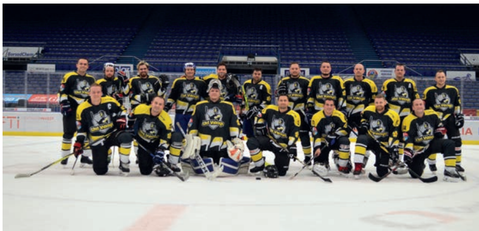
HC Old Village po vítězném zápase proti týmu HC Humrs Ostrava (Ostravar Aréna)