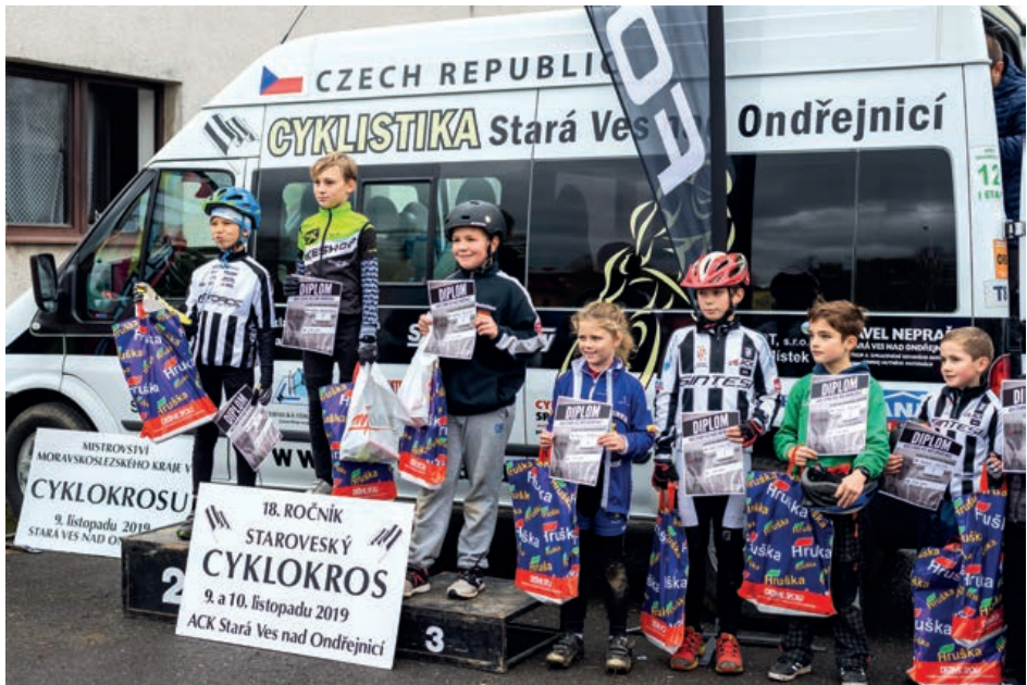
Staroveský cyklokros - vyhodnocení výsledků kategorie nábor, 9. 11. 2019