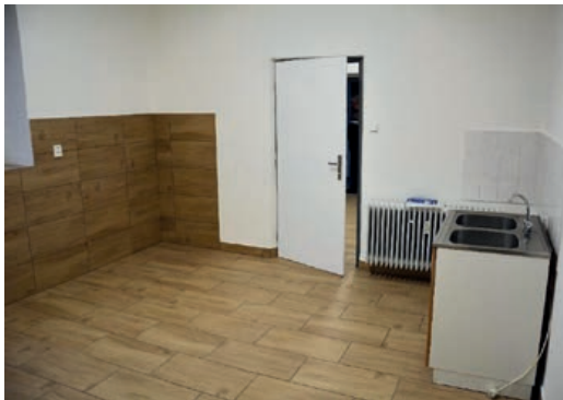
Nový interiér ordinace

Problém starých budov se plně projevil při problémech s ordinací pro dospělé na zdravotním středisku. Práce na rekonstrukci čekárny a místnosti pro zdravotní sestru byly provedeny v rekordně krátké době. Škoda jen, že nebyla ordinace zprovozněna tak rychle, jak byla uzavřena. Rekonstrukce byla prováděna s cílem sanovat prostor na dobu nejméně 5 let. Do té doby musíme rozhodnout o tom, jak se zdravotním střediskem postupovat dál. Ukázalo se však, že rekonstrukce není možná a jediné řešení je zbourat a postavit na stejném místě nebo jinde nové zařízení. Zároveň se na příkladu zdravotního střediska ukázalo, že obec bude v rozpočtu muset dát větší důraz na