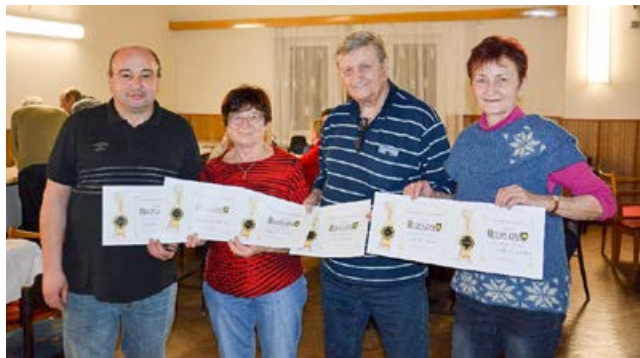
Vítězové 5. ročníku Staroveského koštu

Na zahrádkách mají záhony česneku po zimě ztvrdlý škraloup půdy a ten je třeba rozrušit. Ve skleníku můžeme vysazovat okurky a saláty. Při pěkném, bezmrazém počasí jsme již zahájili postřiky proti přezimujícím škůdcům, použijeme přípravky Kalypso, Mospilan, Dimilin, k lepší výživě rostlin třeba nové ekologické přípravky – Rokosan a Rokohumín (hnojiva). U broskvoní nezapomínejte na postřik proti kadeřavosti, 2x během 2 týdnů. Střídáme mědnaté a sirnaté přípravky. Postupně uvolňujeme zimní ochranu okrasných rostlin. Provádíme řezy růží a výsadbu předpěstované zeleniny.