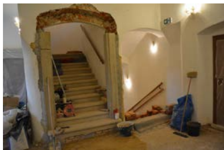
Nové pískovcové schody

Dlouhá léta byli čtenáři Staroveského zpravodaje zvyklí počít si v seriálu Bývaly časy. V něm se objevovaly výňatky z kroniky obce nebo jiných obecních archiválií. Změny, které nastaly v prostorách zámku v době nejrozsáhlejší rekonstrukce za posledních asi 70 let, mě přiměly změnit téma „časů“. Od prvního čísla