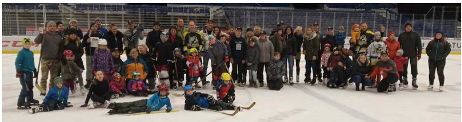
Bruslení s HC Old Village