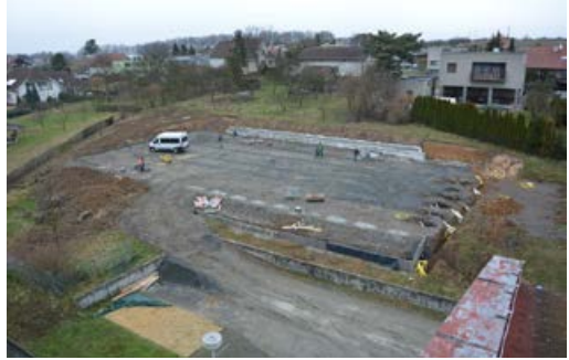
Výstavba hřiště za školou

V soutěži je zapojeno 223 projektů a odborná porota rozhodne koncem dubna. Skončilo ale veřejné hlasování, kde musím