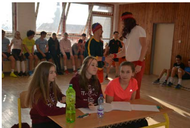
Nultý ročník školní Novoroční latky