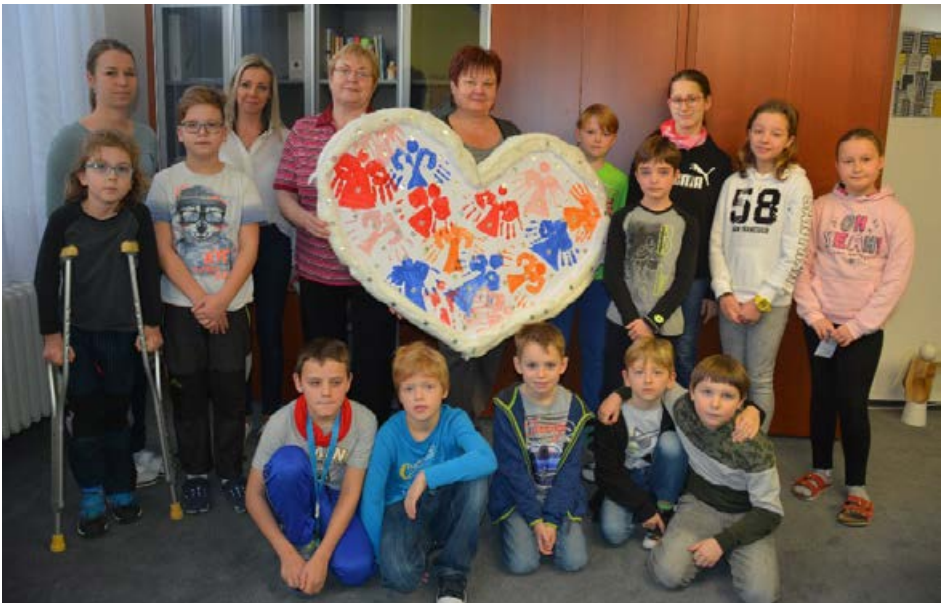
Srdce s láskou darované