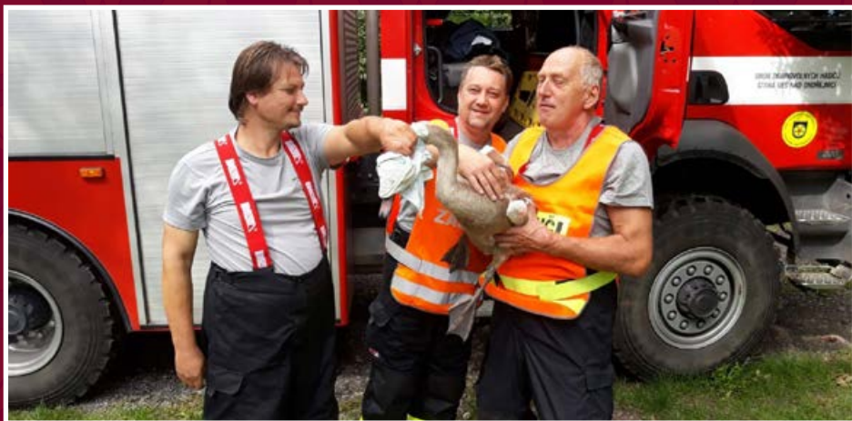
Očhyt pobíhající labuti na I/58 u pálenice