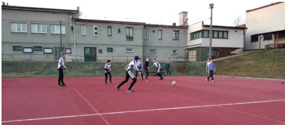
Všeobecná příprava - areál TJ Stará Ves - únor 2020