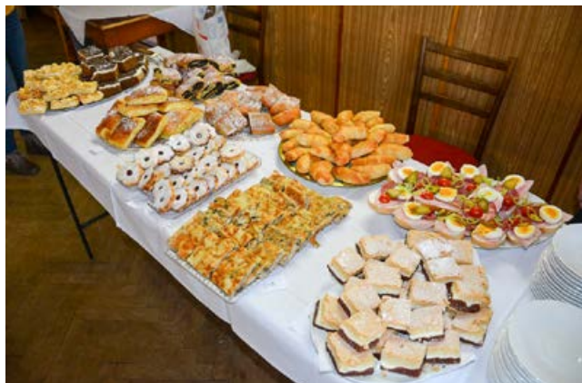
5. ročník Staroveského koštu

Co ale není závislé na vývoji epidemie ani na vládních nařízeních, jsou práce na našich zahrádkách. Tady máme jiného mocného soupeře – přírodu. Ta si s námi letos zle pohrává a ranní mrazíky (nebo spíš mrazy), větší než za celou zimu, už se nejspíš postaraly o letošní úrodu raných odrůd meruněk bez ohledu na to, že jsme 20. března přivítali jaro.