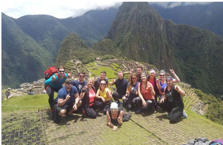
Machu Picchu - ukazujeme lamičky