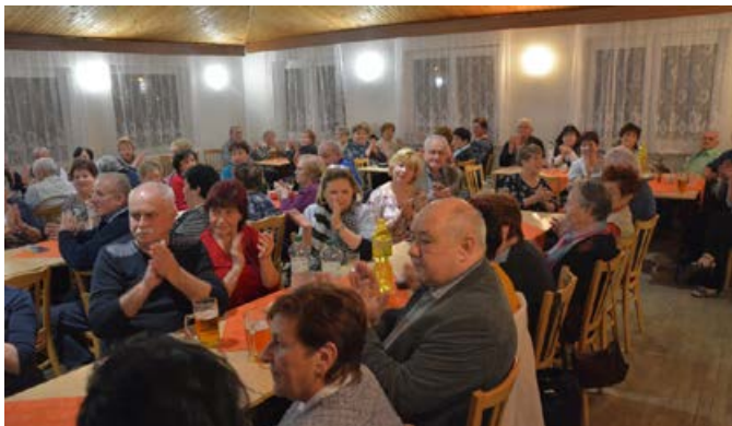
Výroční schůze SPOPVES s programem