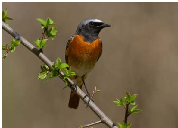
Sameček rehka zahradního ( Phoenicurus phoenicurus ) je pestřeji zbarvený „bratranec“ běžného rehka domácího. Je vzácnější, ale možná zahnízdí i ve vašem okolí.

V současné situaci je možné si i takto - bez vzájemných kontaktů - navzájem sdělovat poznatky o výskytu živočichů v naší obci. Až to bude možné, mohli bychom s vážnějšími zájemci provádět zoologické průzkumy na přírodně zachovalých lokalitách Staré Vsi n. O. a Košatky, zaměřené na faunu obratlovců a některé skupiny bezobratlých živočichů.