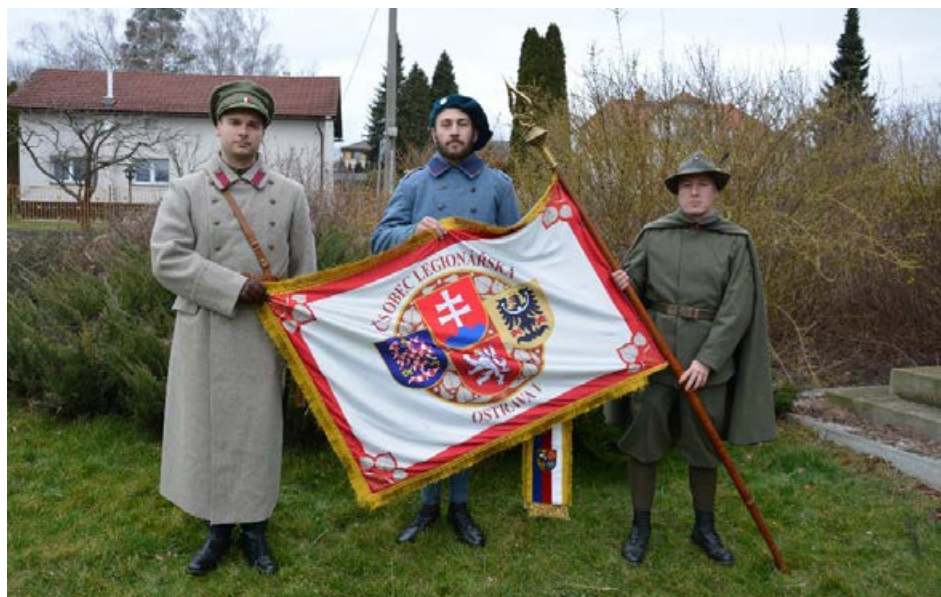
Československá obec legionářská, jednota Ostrava I