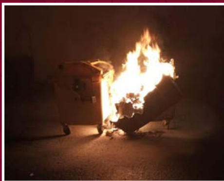
Likvidace požáru kontejnerů na tříděný odpad