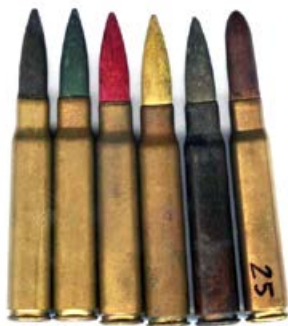
Náboje s dřevěnou kulkou