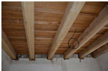
Rekonstrukce věžní místnosti

v roce 2018 jsem se pokoušel prostřednictvím „speciálu“ připomenout čtenářům poslední zásahy do naší prvořadě historické památky z přelomu století a v rubrice Co je nového na zámku informovat čtenáře o tom, co se aktuálně odehrává za uzavřenými zdmi zámku. Tam zpočátku, v době největších bouracích prací na začátku roku 2018, neměl přístup prakticky nikdo kromě stavbařů. Tento stav se pomalu ale jistě začíná chýlit ke konci – jinými slovy: rekonstrukce 2. podlaží zámku (tedy její nejpodstatnější a nejviditelnější část) se blíží do finále. Pokud vše dopadne tak, jak má, bude dnešní příspěvek na čas poslední. Vše hotovo totiž určitě není a na větší zásahy bude dále čekat skлеpení zámku a nejvyšší patro.