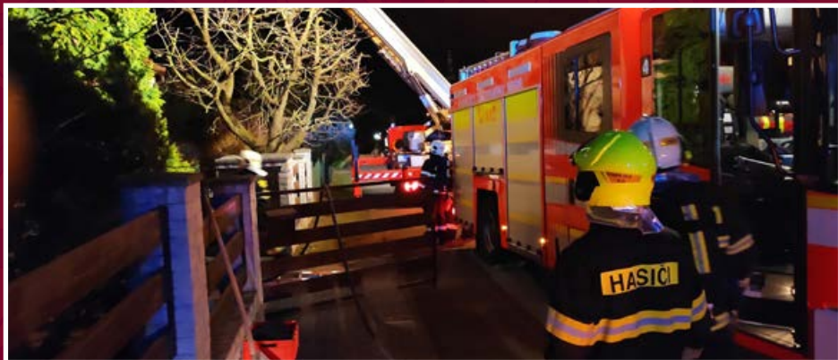
Požár komínu na ulici Ke Kapli