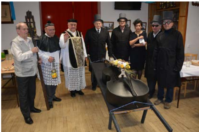
Důchodci opět vesele pochovali basu