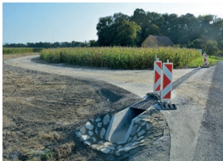
Nová místní komunikace v lokalitě Zimný důl