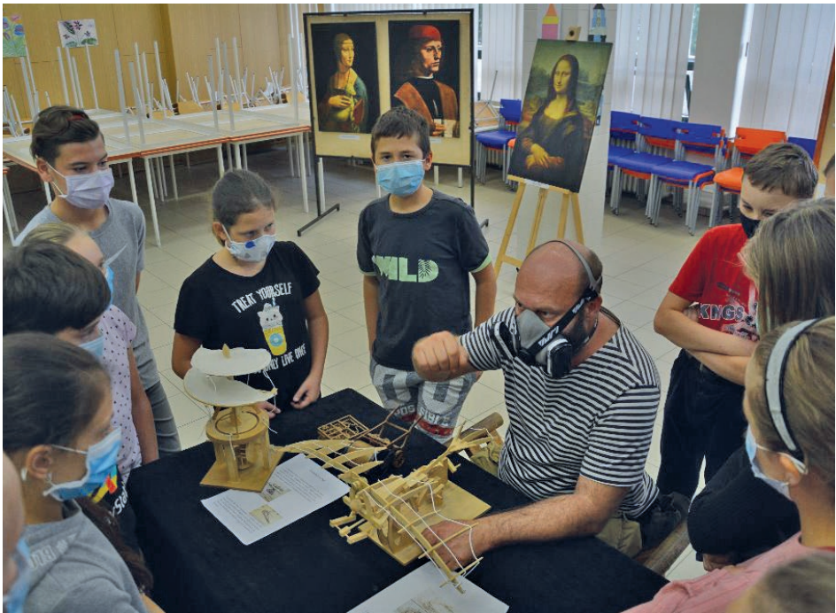
Projektový týden s Leonardem da Vincim