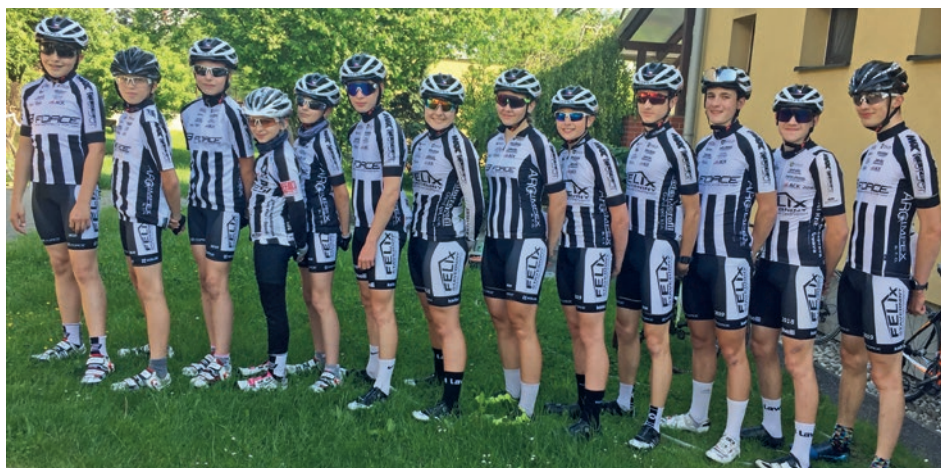
Staroveský tým před společným tréninkem