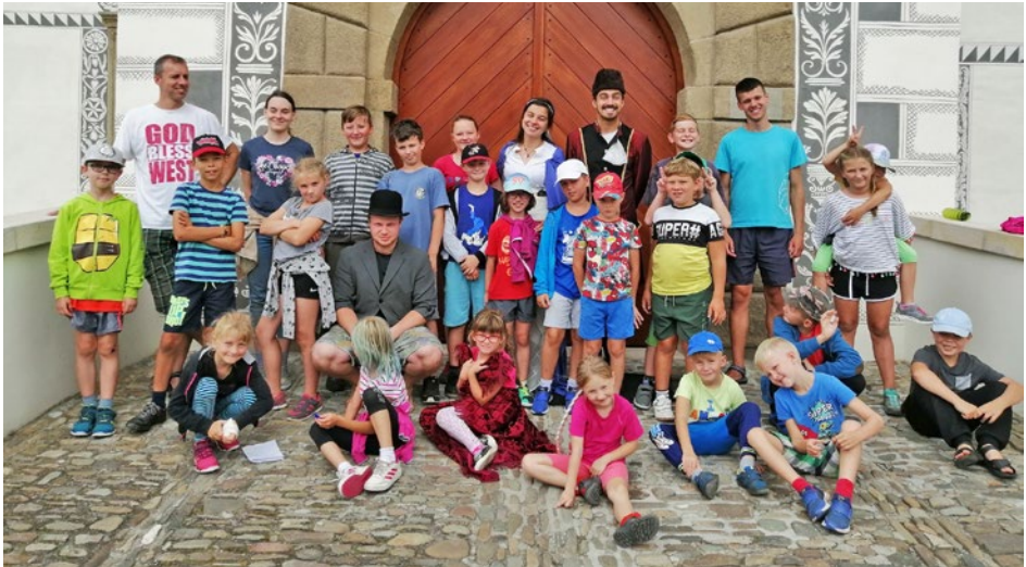
Farní příměstský tábor