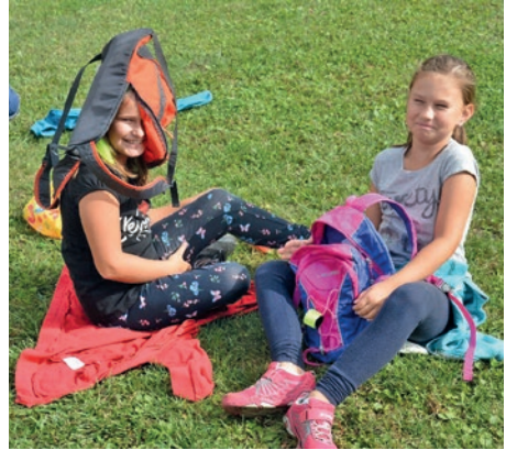
Den v přírodě

Na závěr přeji všem svým kolegům do nového školního roku hodně sil a trpělivosti s prozorem školy, vám, rodičům, pevné nervy a hlavně radost z úspěchů vašich dětí. Těším se na vzájemnou spolupráci, všechno se dá vyřešit, když spolu o tom budeme hovořit. Vždyť nám