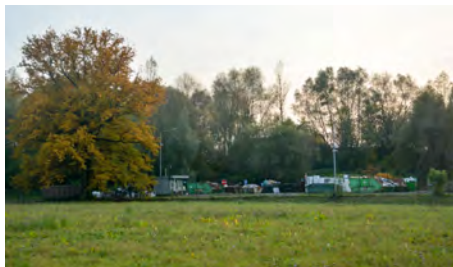
Původní sběrný dvůr