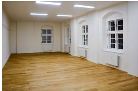
Nová dubová podlaha velké místnosti 2. patra