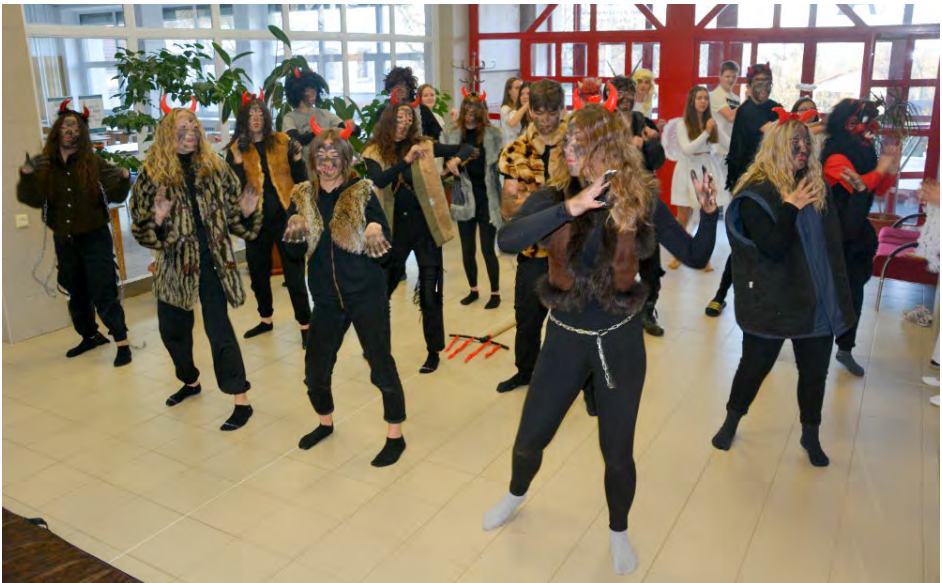
Mikuláš s čerty