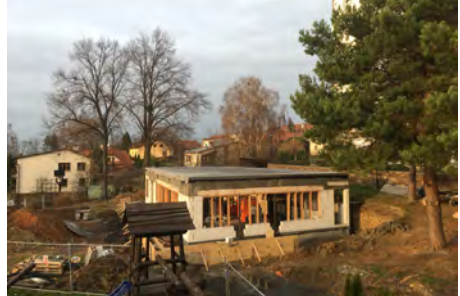
Hrubá stavba Komunitního centra