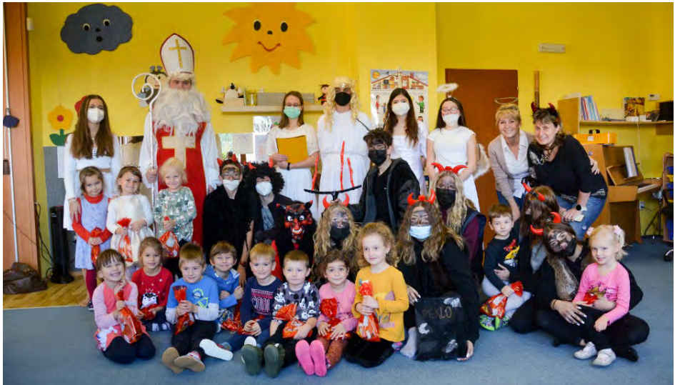
Mikuláš s čerty ve školce