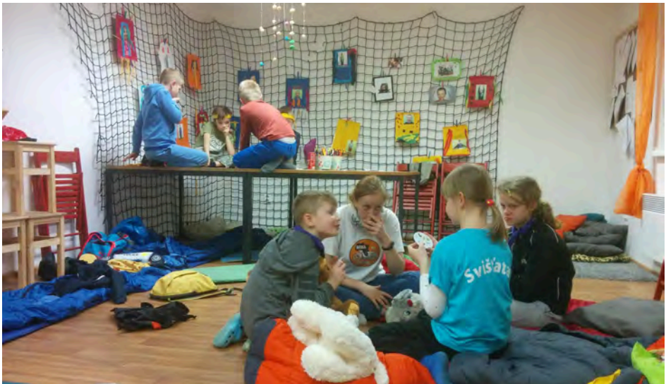
Noc na klubovně

Oddíl Svištata se schází celoročně v naší klubovně v objektu bývalých kasáren (nad sběrným dvorem) a již čtvrtým rokem mohou využívat tyto nově zrekonstruované prostory. Děti se zde setkávají každou středu od 17 hod. a srdečně jsou vítáni všichni noví svišti ve věku od 7 do 15 let. Oddílová činnost je zaměřena na volnočasové aktivity dětí - především na rozvíjení jejich znalostí a dovedností prostřednictvím práce s nejrůznějšími materiály, her a soutěží, pohybových aktivit zahrnujících i poznávací a turistické výlety a akce. Oddílová