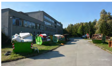
Provizorní sběrný dvůr