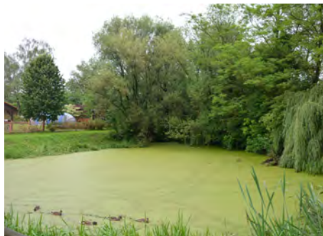
Vaňkův rybník před zahájením prací