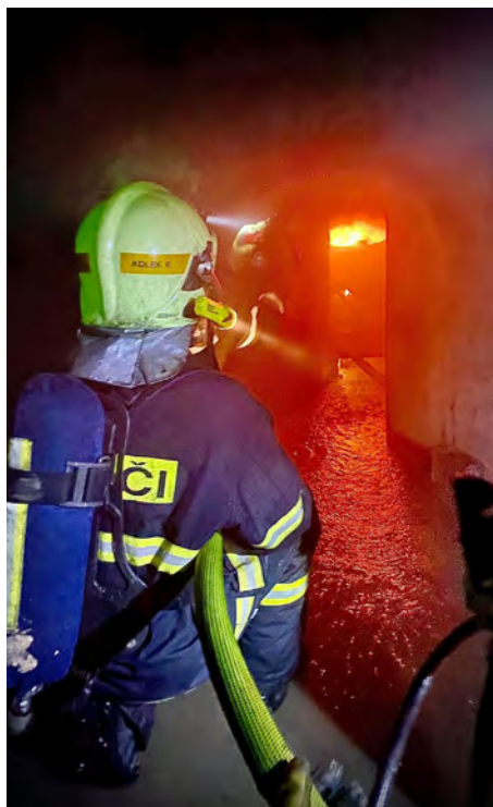
Výcvik hašení požárů