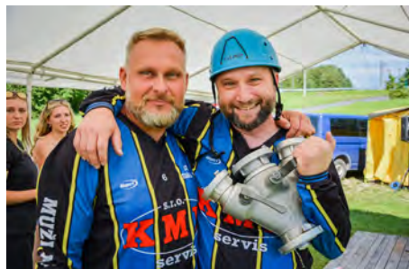
O pohár obce 14. 8.

Velkou zkouškou psychické odolnosti pro nás pak byly dny po 24. červnu, kdy obyvatelé jihomoravských vesnic zasáhlo tornádo, v důsledku něhož přišli o své blízké, o střechy nad hlavou, majetek, zdroj obživy... Na pomoc jim přispěchali dobrovolníci z celé republiky a náš sbor nebyl výjimkou. O víkendu 26. 6.-27. 6. jsme se zapojili do odstraňování škod a na vlastní oči jsme viděli ohromný rozsah řádění živlu. Zde je na místě poděkovat Vám všem, kteří jste přispěli do naší (materiálové) veřejné sbírky, případně jste pomohli finančně.