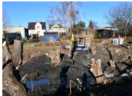
Práce na Vaňkovu rybníku