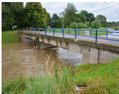
Most přes Lubinu čekající na rekonstrukci