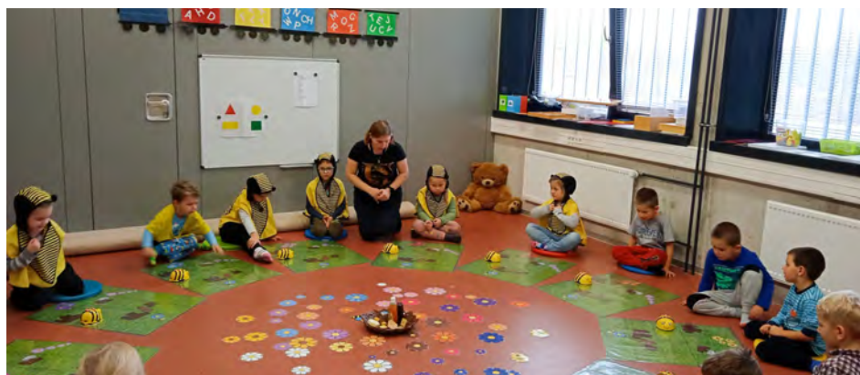
Programování pro nejmenší

Podzimní období však s sebou přineslo i trápení v podobě velmi časté a mnohdy dlouhodobé nemocnosti dětí, ale také personálu. Některé děti byly za poslední tři měsíce ve školce kvůli nemocem jen pár dní. Nemoci dýchacích cest a různé virózy jsou nejčastější, vlečou se, často se i několikrát vracejí a trápí děti v takové míře, na jakou jsme dosud nebyli zvyklí. Víme, že je to pro děti, ale i pro rodiče velmi nepříjemné nejen proto, že se děti dlouho léčí a trápí a lékaři musejí často i opakovaně nasazovat antibiotika, ale pro rodiče je těžké i to, že musejí s dětmi dlouhodobě a opakovaně zůstat doma na tzv. „paragrafu“. Málokdo má to štěstí, že má „hlídací“ babičku nebo jiného rodinného příslušníka, který by o nemocné dítě mohl pečovat. Než se však dítě vrátí do dětského kolektivu, mělo by být řádně doléčeno, aby se infekce šířila co nejméně. Pedagogové v mateřské škole jsou povinni chránit zdraví všech dětí a přítomnost nemocného nebo