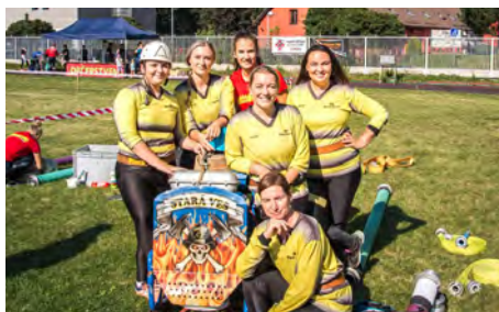
Velká cena Frýdku-Místku 11. 9.