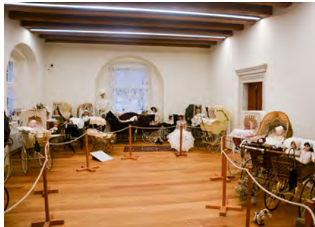
Prostory nové knihovny

Mimořádný stavební ruch předešlých let s hlukem sbíječek, vrtaček nebo tesařských kladiv už je (naštěstí) minulostí, přesto se dále pomalu posunujeme vpřed, k vytčenému cíli. Tedy ke stavu, kdy budeme mít zámek kompletně zrekonstruovaný a plně využitelný.