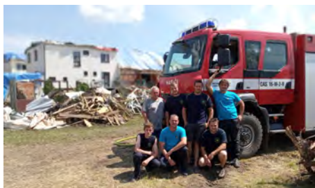
Mikulčice 26.-27. 6.

Co se týče zásahové jednotky našeho sboru, ta měla i letos (Covid-Necovid) více než napilno. Během roku zasahovala u tří požárů (z toho jeden na území obce), absolvovala více než 25 technických zásahů, mezi něž se řadí zásahy u dopravních nehod, úniku nebezpečných látek, transporty pacientů, odstraňování padlých stromů, požární dozory, čištění kanalizace a komunikací či odchyt bodavého hmyzu. Kromě tohoto jsme se ve dnech 8. 5. a 15. 5. zúčastnili „Výcviku hašení požárů v uzavřených prostorách“, konaného v Dolní oblasti Vítkovice.