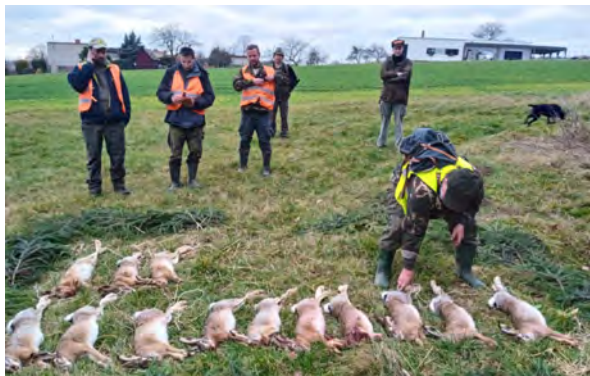
Hon 20. 11. 2021

Činnost spolku však nespočívá jen v práci a péči o honitbu a zvěř v ní žijící. Vyžíváme se i společensky. Několikrát za rok se scházíme na členských schůzích, přátelských posezeních. Snažíme se lásku k přírodě vzbuzovat i u našich dětí ve školách při besedách s myslivci a jejich čtyřnohými přáteli. Děti nám zase pomáhají sbírat lesní plody, které pak předkládáme zvěři do krmelců a zásypů. Hlavně tak pracují děti z Krmelína. Ty nejlepší jsou pak oceněny a pozvány na dobrou večeři i se svými rodiči.