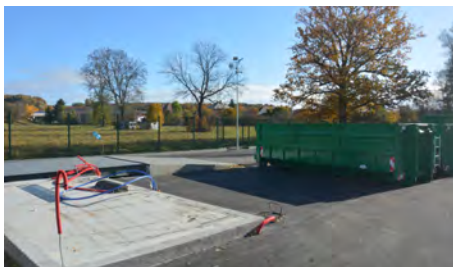
Rekonstrukce sběrného dvoru

hospodářství v roce 2022 zvýšit o 10 Kč za měsíc, což je 780 Kč na občana a rok. Rozhodně to nebude znamenat snížení podílu obce na provozu systému odpadového hospodářství, spíše předpokládáme jeho další růst o cca 100 Kč na každého poplatníka.