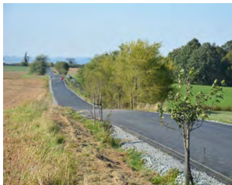
Polní cesta k „radarce“, výsledek komplexních pozemkových úprav