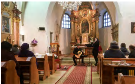
Adventní koncert v kostele