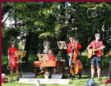
Koncert skupiny Zhaslo v peci v Košatce