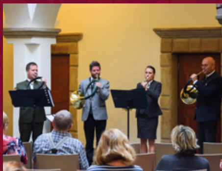
Koncert lovecké hudby na zámku